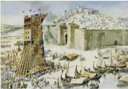
1147 _____ - as origens da aliança: Os ingleses ajudam os portugueses a recuperar Lisboa aos Mouros.