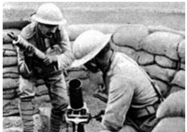
1914-1918 – _____ Portugal participa e apoia o seu aliado mais antigo.

1943 e 1982 – Portugal permite ao RU a utilização da sua base aérea nos Açores, em dois conflitos, _____, e _____.