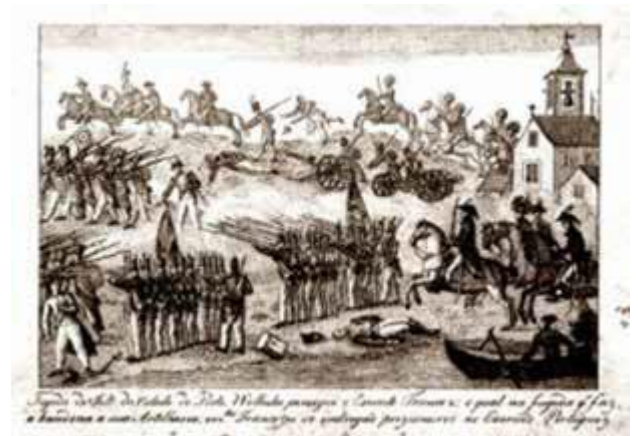
1807-1810 – _____ – O Reino Unido ajuda Portugal a defender-se e a expulsar as forças Francesas.