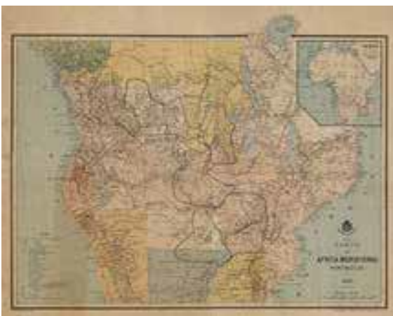
1886 – _____ – Portugal e o Reino Unido discordam sobre a divisão das colónias africanas.