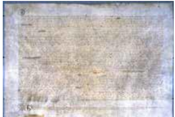
1373 _____ é um dos tratados assinados para dar início à aliança.