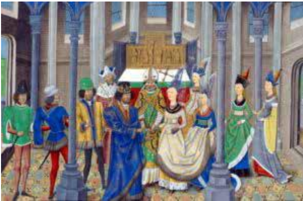
1387 – _____ – torna a Aliança mais poderosa.