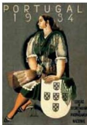
Cartaz de propaganda ao Estado Novo.