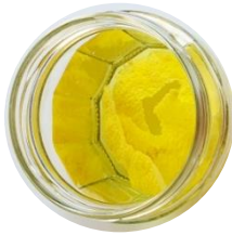
chá de limão