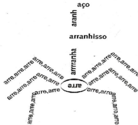
SALETTE TAVARES, Poesia Experimental — I