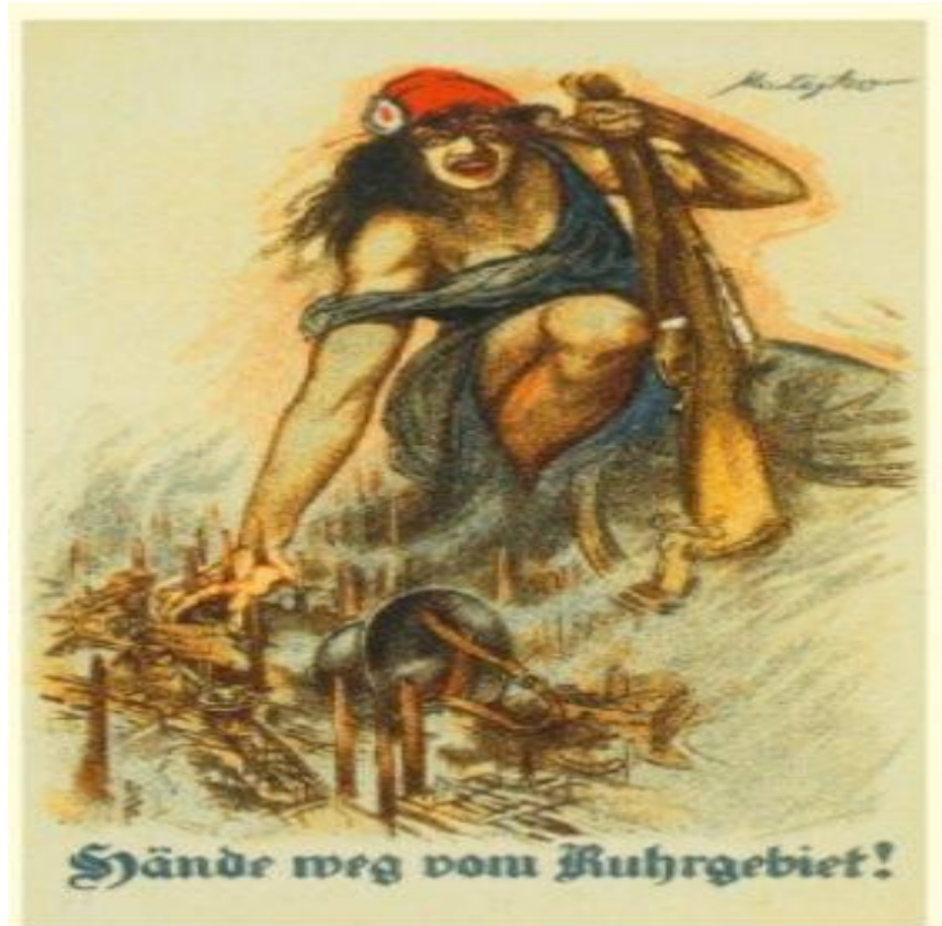
“Tirem as mãos do Ruhr”, Cartaz alemão de 1923 alusivo à ocupação francesa do Ruhr.

2 . Explique de que forma o cartaz expressa o ódio da Alemanha para com a França.