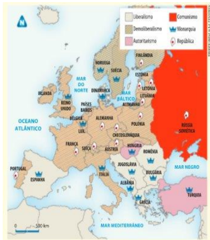
A Europa política em 1920

1. Indique cinco efeitos da Primeira Guerra Mundial na geografia política da Europa e do Médio Oriente.