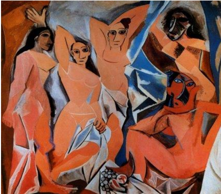
Pablo Picasso, As meninas de Avinhão , 1907

6. Indique dois aspetos do quadro que contrariem a forma de representação tradicional.