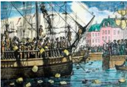
Boston Tea Party

1- Refira a causa da revolta de Boston Tea Party .