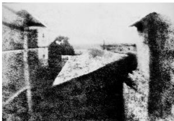
Primeira fotografia, feita por Joseph Nicéphore Niépce, em 1826 na França.