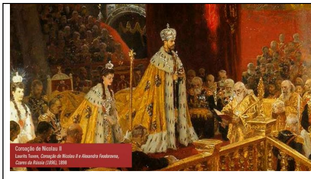
Coroação de Nicolau II Laurits Tuxen, Coroação de Nicolau II e Alexandra Feodorovna, Czaros da Rússia (1896), 1896